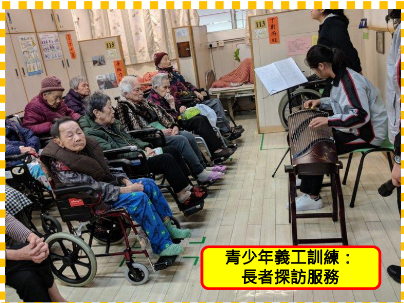
青少年義工訓練： 長者探訪服務