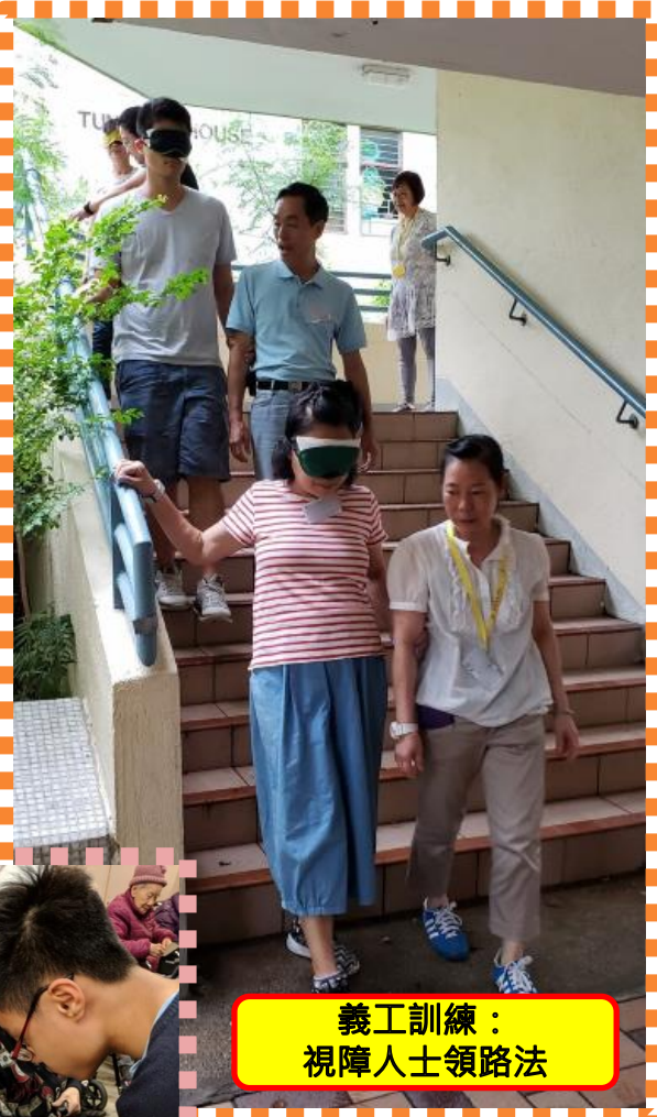
義工訓練： 視障人士領路法