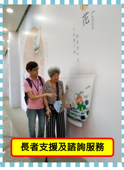
長者支援及諮詢服務