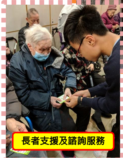
長者支援及諮詢服務