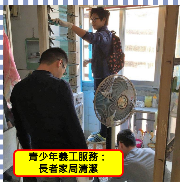
青少年義工服務： 長者家局清潔